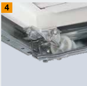
Odstavný prostor pro vodící kladku

Chcete více bezpečnosti? V tom případě se obraťte na autorizovaného prodejce Hörmann!