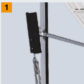
Ochrana proti sevření prstů

Vrata se bezpečně zastaví v prohlubni v kolejnici.